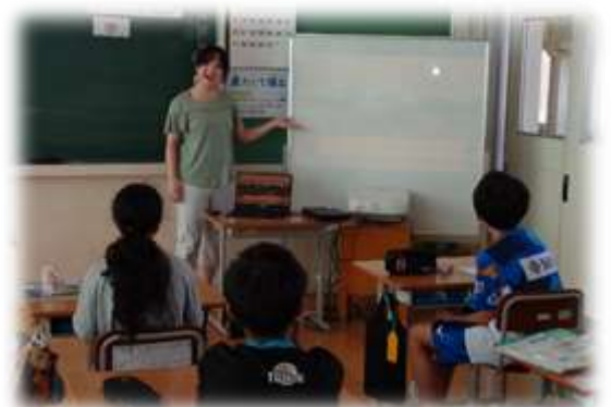
意欲的に外国語・外国語活動の学習に取り組んでいる